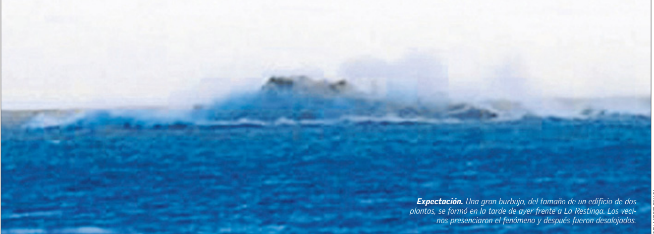
Expectación. Una gran burbuja, del tamaño de un edificio de dos plantas, se formó en la tarde de ayer frente a La Restinga. Los vecinos presenciaron el fenómeno y después fueron desalojados.